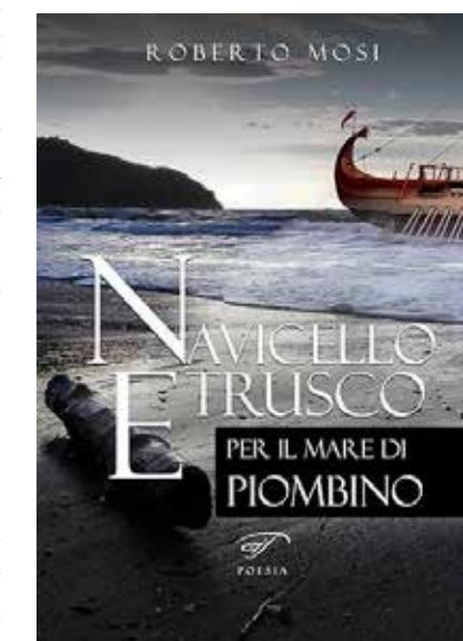
Navicello etrusco - Roberto Mosi

Il vulcano / sprigiona fuoco / e fumo sulla / spiaggia, nel / cratere legni della / pineta. / Il gioco di questa / mattina. / Le onde lo / circondano / a tratti, lo / lasciano libero. Si rinnova l'Arte / degli Etruschi: / forni fusori per / fondere pirite / dell'Elba e sulla / sabbia ai nostri / piedi brillano al / sole pezzi / di argilla rossa, / polvere di ferro / frammenti di altri / tempi. Un'onda travolge / il vulcano, / il gioco di questa / mattina. (Lirica Lo specchio di Turan - Il VULCANO, R. Mosi - Silloge "Navicello Etrusco", il Foglio. Piombino, 2018)